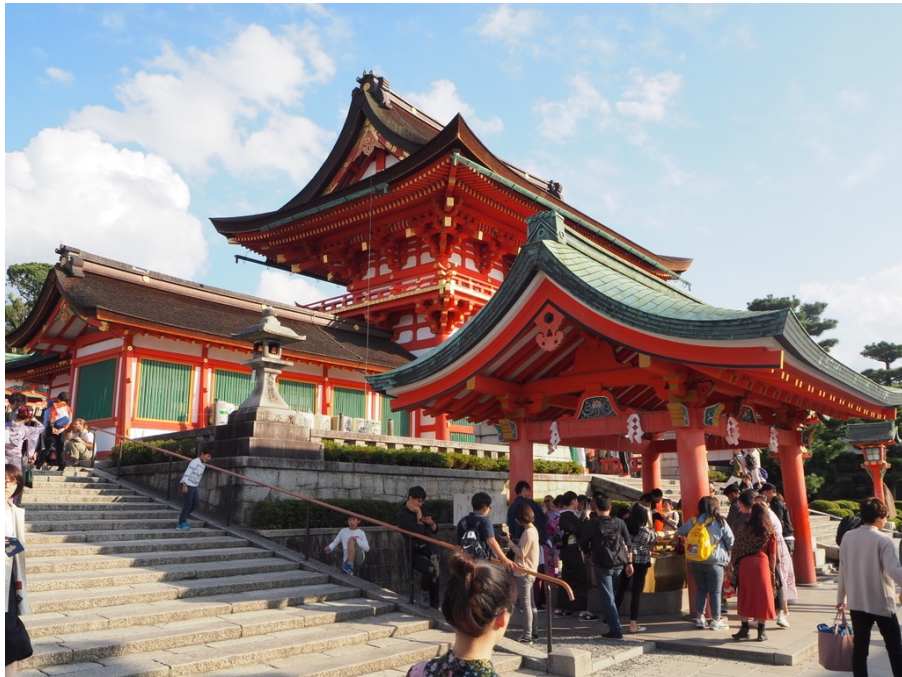
Kyoto: Fushimi Inari-Taisha